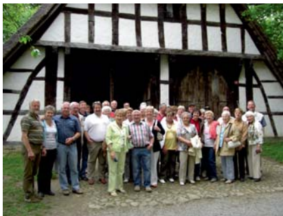
Gemeinsame Fahrten Ausflüge